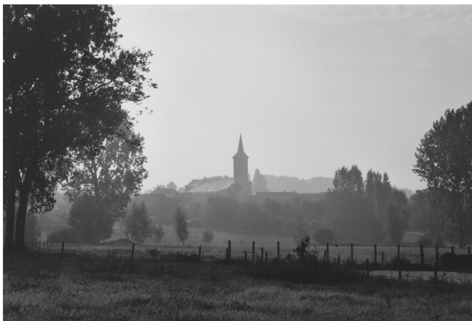
Kester in de herfstmist , gezien van de Edingssteenweg.

Inderdaad niet te missen! Bestel nu reeds uw plaats op onze sprookjestrain. Bij voorverkoop kost uw ticket slechts € 5,- of een lachertje voor een avond dolverrassend muzikaal plezier!